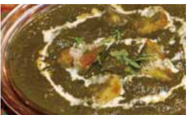
アルパラク Aloo palak 800 円 ジャガイモとほうれん草のカレー