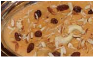
カシミリチキンカレー Kashmiri chicken curry 890 円 バター、生クリーム入りの甘味カレー