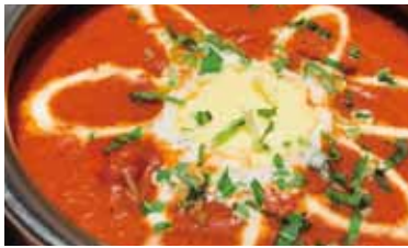
バターチキンカレー Butter chicken curry 950 円 バター風味のチキンカレー