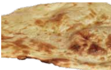
ナン Nan 290 円 土窯で焼いたインド風パン