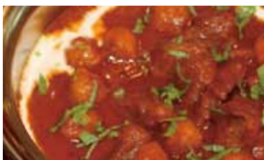
チャナマサラ Chana masala 800 円 ひよこ豆のマサラカレー