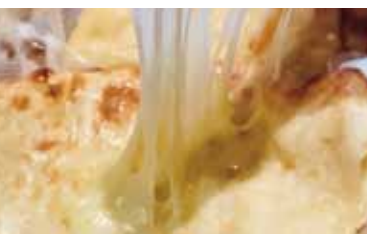
チーズナン Cheese nan 400 円 チーズ入りのナン