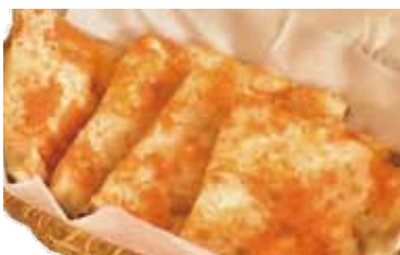
カシミリナン Kashmiri nan 420 円 ナッツ、ブドウ入りのナン