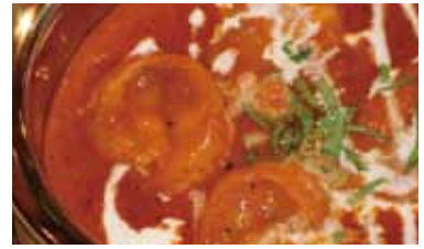
プロンマサラ Prawn masala 880 円 海老入りのマサラカレー